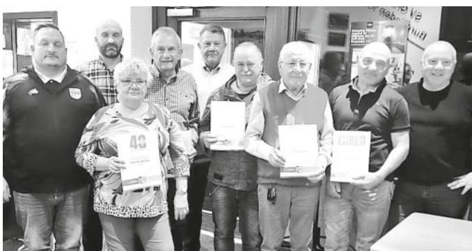
Ehrung der langjährigen Mitglieder des SV Burgrieden

Im Rahmen der gemeinsamen Sportlerehrung von Landkreis und Sportkreis Biberach wurden am vergangenen Freitag 258 Sportle-