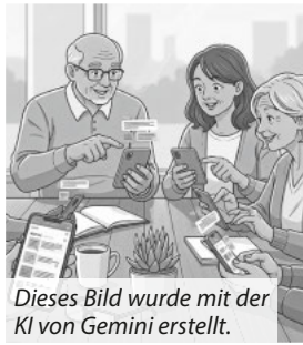
Dieses Bild wurde mit der KI von Gemini erstellt.

zient planen, Erinnerungen einrichten und Ihre Termine mit anderen teilen können. Dieses und weitere Themen möchten wir mit Ihnen auffrischen. Kommen Sie vorbei – wir freuen uns! Fragen zur Veranstaltung richten Sie bitte an Gudrun Konstroffer, Telefon 07392 9288744 oder 01525 9916981. „Onliner“ können ihre Fragen auch per E-Mail stellen. info@lebensqualitaet-burgrieden.de