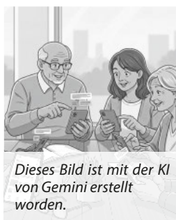
Dieses Bild ist mit der KI von Gemini erstellt worden.