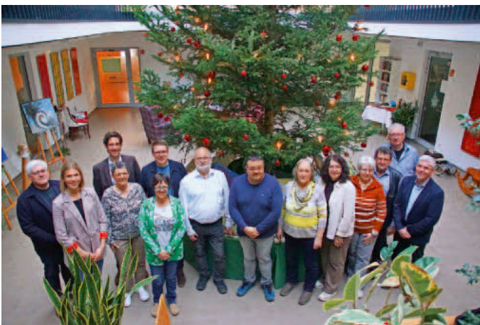
Der DRK-Kreisverband Biberach e.V. feierte gemeinsam mit Mitarbeitenden, Unterstützern, Wegbegleitern, Bewohnern und Angehörigen der Wohngemeinschaft „Lebenswert“ das einjährige Jubiläum.

Gemeinschaftlich, selbstbestimmt und mitten im Ort: Seit 2017 steht die Wohngemeinschaft „Lebenswert“ in Burgrieden für ein zukunftsweisendes Wohnkonzept im Alter. Entstanden aus einer gemeinsamen Initiative des Vereins Lebensqualität Burgrieden e.V., der Bürgerstiftung Burgrieden und der Gemeinde Burgrieden, bietet die WG Seniorinnen und Senioren ein Zuhause, das Eigenständigkeit mit verlässlicher Unterstützung verbindet. Ein wichtiger Schritt in der Weiterentwicklung des Projekts war die Übernahme der Alltagsbegleitung durch den DRK-Kreisverband Biberach e. V., die nun seit gut einem Jahr besteht.