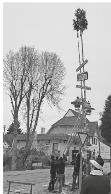
Der Narrenbaum wird gestellt

Abfahrt Rottalhalle 11:30 Uhr, Rückfahrt 17:00 Uhr