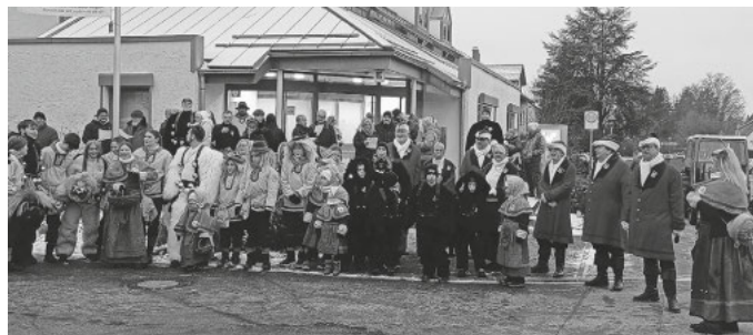
Die Narrenzunft Burgrieden eröffnet die närrische Zeit.

Die Fasnet 2026 in Burgrieden wurde am 06. Januar eröffnet. Den Auftakt bildete der Seniorennachmittag, bei dem die Kinder der Narrenzunft ihren Tanz vorführten und das Publikum begeisterten. Die kleinen Narren zeigten mit viel Elan, dass die Fasnet nicht nur den Erwachsenen, sondern auch den Jüngsten am Herzen liegt. Anschließend versammelten sich die Narren auf dem Dorfplatz, wo das 3. Narrenbaumstellen der Gemeinde stattfand. Mit unserem Narrenlied und einem kräftigen "Etz guggat au - Ha laß me gau" wurde der närrisch geschmückte Baum aufgerichtet. Der Abend wurde im Schützheim ausgeklungen, wo die Maskentaufe stattfand. Hier erhielten alle Mitglieder ihren Sprungbündel und die neuen Mitglieder wurden offiziell in die Gemeinschaft der Narren aufgenommen.