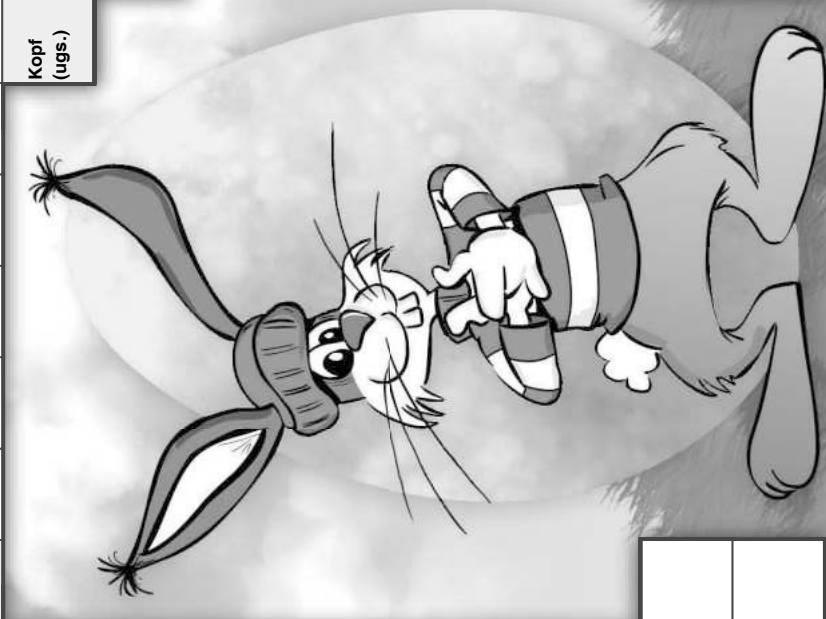
Illustration: © Trummer/DEIKE