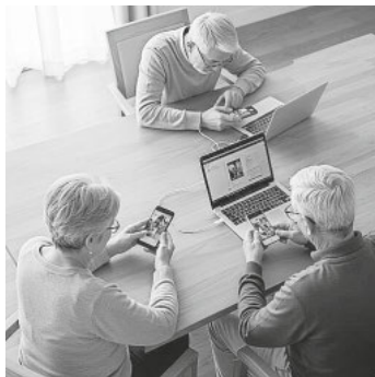
Dieses Bild ist mit der KI von Gemini erstellt worden.