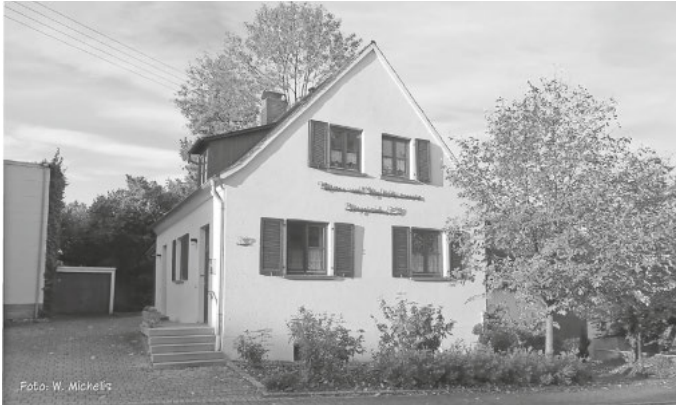
Alte Molke

Auf Ihren Besuch freut sich das Organisationsteam.