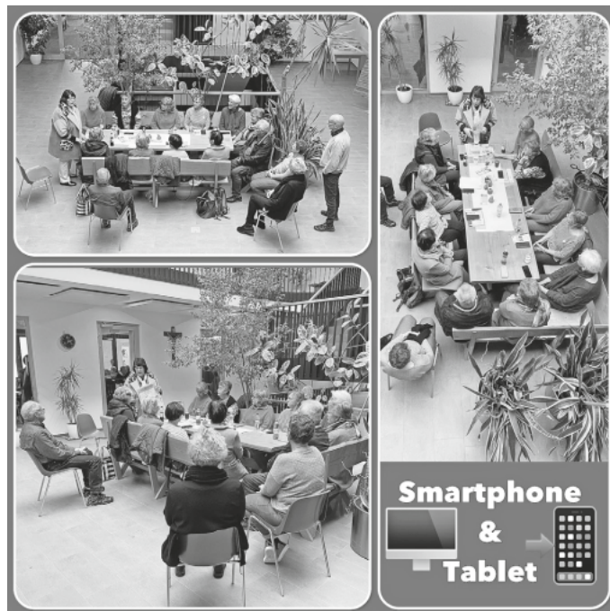
Teilnehmende am Workshop im Atrium.

„Onliner“ können Ihre Fragen auch per E-Mail stellen. burgrieden@seniorenakademie-digital.de