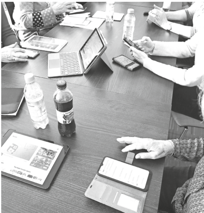
Teilnehmende üben am Smartphone.