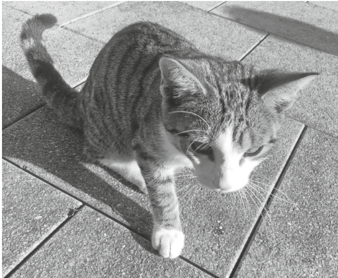
Entlaufende Katze? Wer sucht sie?

Hausverwaltung Wohnpark Burgrieden H.Härle