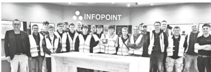
Die Besucher bei Röchling