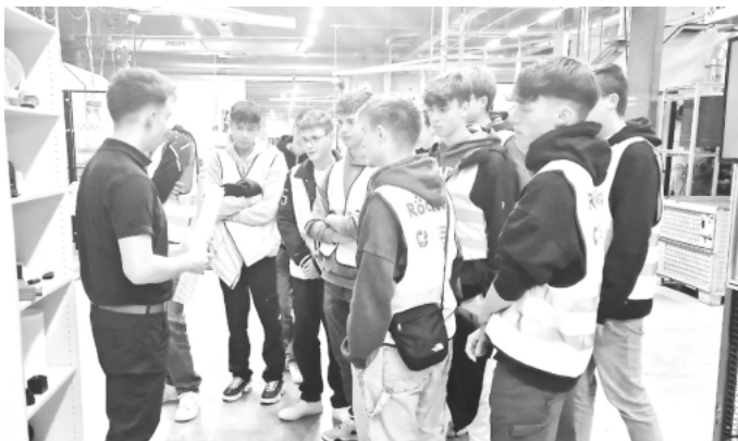
Die Jungs bei der Besichtigung