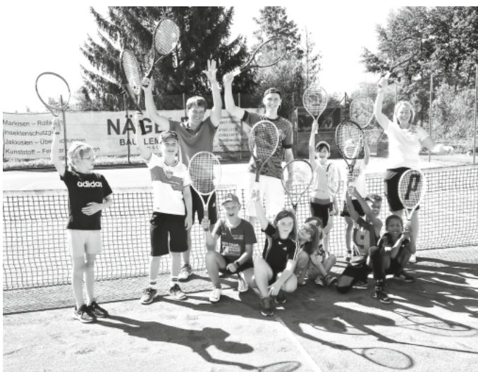
Gemeinsames Gruppenbild