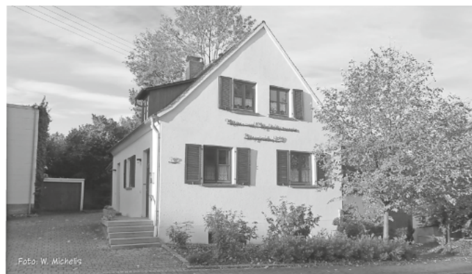
Alte Molke

in unserem Vereinsheim „Alte Molke“, Hauptstraße 32, in Burgrieden statt. Auch Nichtmitglieder sind herzlich willkommen. Auf Ihren Besuch freut sich das Organisationsteam.