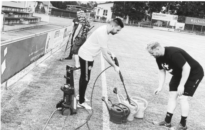
Banden wurden geputzt