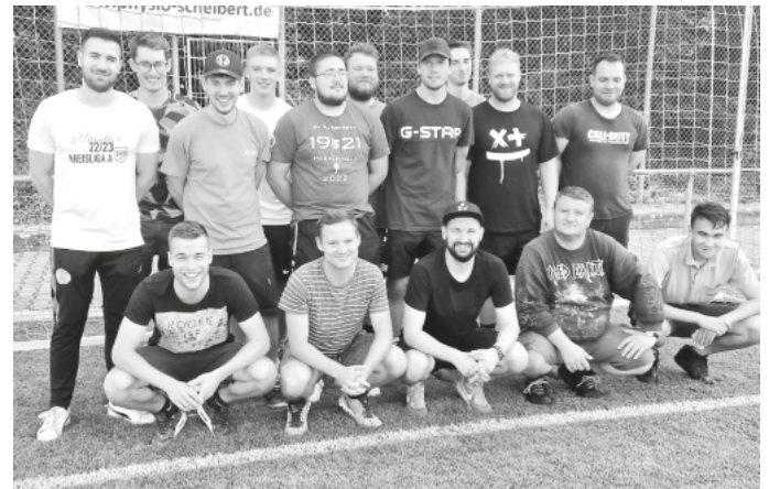
Die vielen fleißigen Helfer hatten viel Spaß!