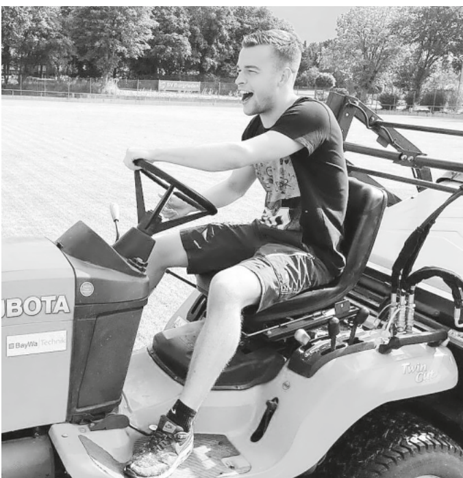
Einfach viel Freude bei der Arbeit!