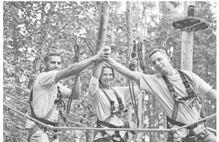
„Viele schaffen mehr“ - Crowdfunding-Aktion der VR Bank Laupheim Illertal ist in der zweiten Runde