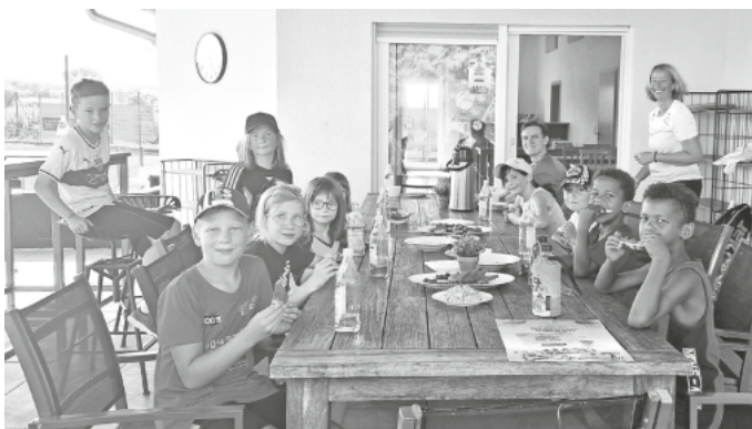
Verdiente Pause beim Schnuppertraining