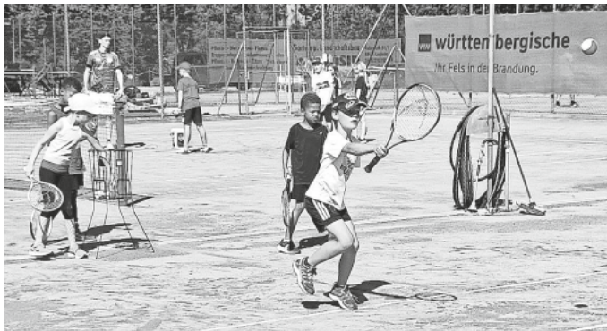
Die ersten Schläge

nisbällen spielten die Kids eine Art Fußballtennis und übten mit dem Schläger erste Kontrollschläge mit dem Ziel, den Ball übers Netz zu bringen. Es folgte eine Technikschiung mit Zuwerfen und Schlagen der Bälle. Kleine Matches waren die Highlights zum Ende des Programmes. Die Jüngeren hatten sichtlich viel Spaß als diese mit Softbällen über Kleinfeldnetze spielen durften. Die Größeren nutzten bereits das Midcourtfeld. Abschließend gab's noch Pizza, eine Urkunde und der Sprung durch die Beregnungsanlage sorgte für die angenehme Abkühlung.