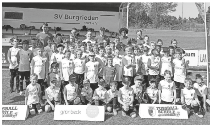
Gruppenfoto mit den Trainern vom FC Augsburg