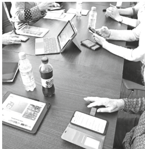
Veranstaltung im Brunnencafé

„Onliner“ können Ihre Fragen auch per E-Mail stellen. burgrieden@seniorenakademie-digital.de