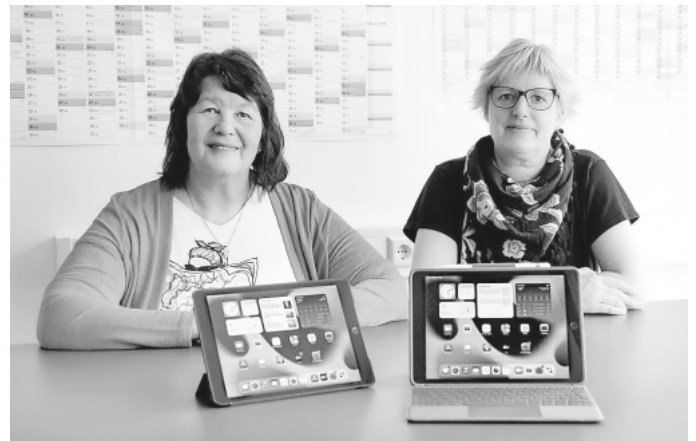
Digitalmentorinnen in Burgrieden.