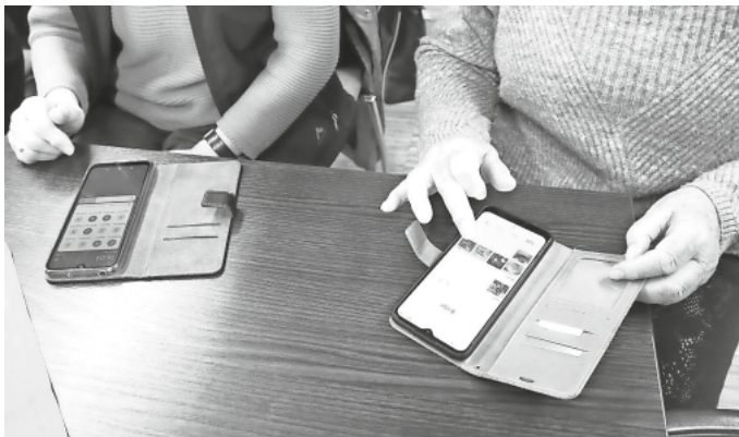
Praktische Übungen bei der Veranstaltung im Brunnencafé

„Onliner“ können Fragen gerne auch per E-Mail stellen. burgrieden@seniorenakademie-digital.de