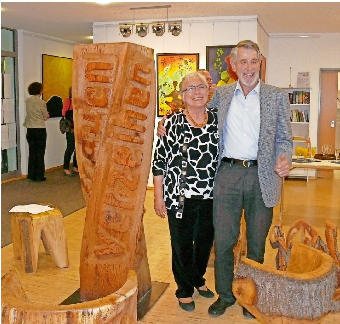
Die beiden Künstler inmitten ihrer Werke.

Die Werke sind noch bis 22. Juni im Rathaus zu sehen.