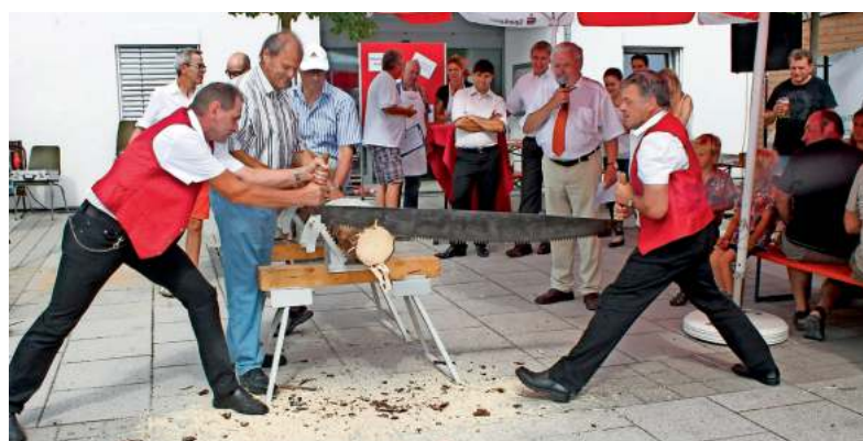
Immer eine tolle Aktion: der Holzsägewettbewerb