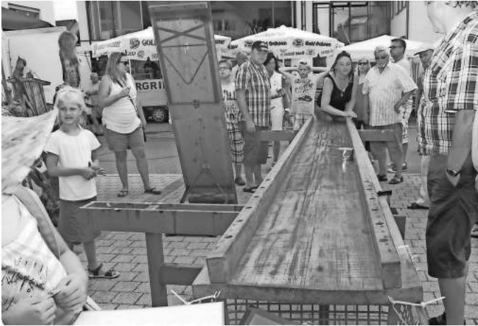
Das „Sax-Wuscht-Bixa-Schiaba“ bei groß und klein beliebt