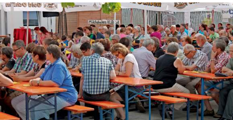
Gut besuchter ökumenischer Gottesdienst zum Auftakt am Sonntag