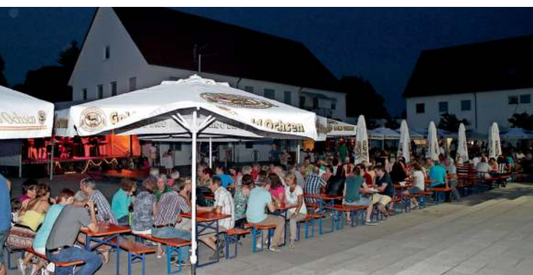
Die laue Sommernacht lud zum Verweilen bei südländischen Temperaturen ein