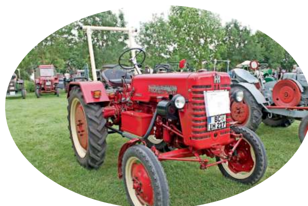
Erfreute sich besonderer Beliebtheit: das erstmalig ausgetragene Oldtimertreffen