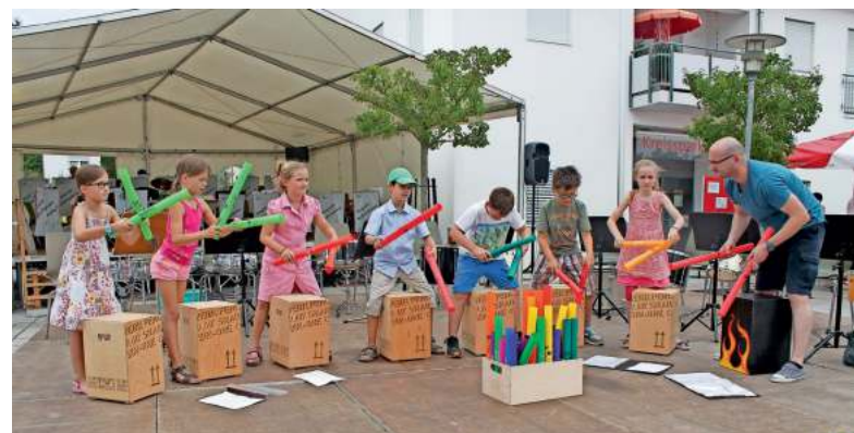
Die Trommelgruppe der Schule Burgrieden zeigt ihr Können