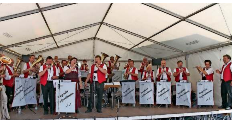
Gut drauf: die Burgrieder Dorf Musikanten und ihr Sängertrio