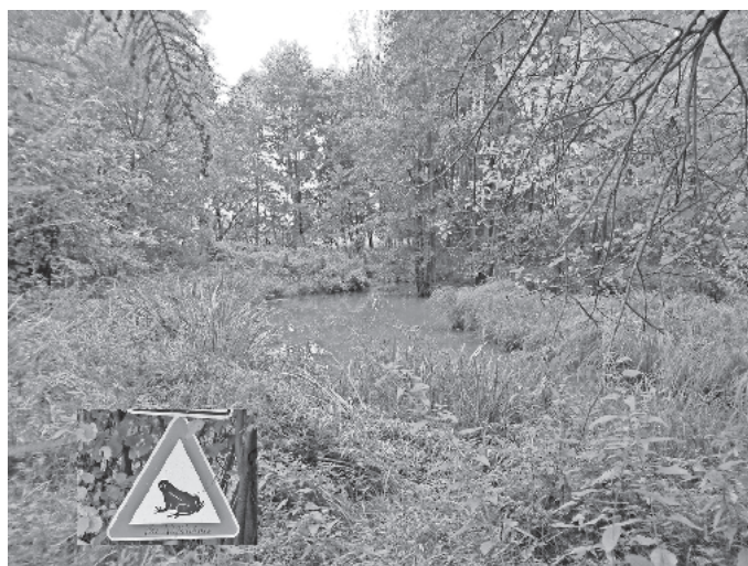
Biotop am Gattenheim