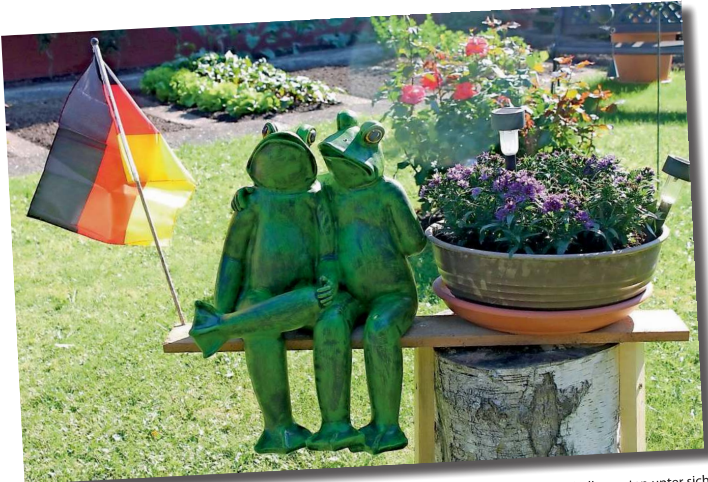
„Grüne“ Fußballexperten unter sich: „Wetten, dass wir Weltmeister werden“.