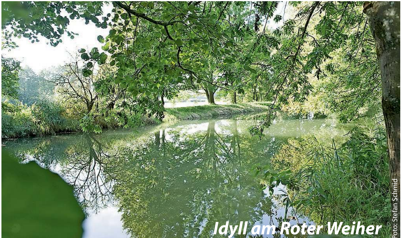
Idyll am Roter Weiher