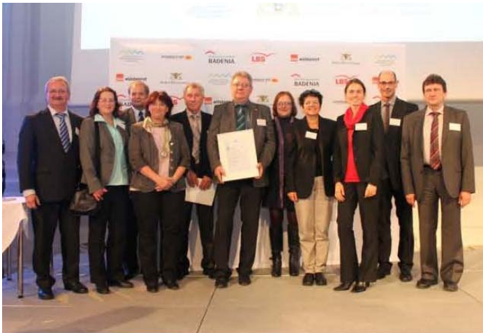
Große Freude herrschte bei der Burgriedener Delegation.

sen darauf schließen, dass das Konzept seine Ziele vollständig verwirklichen kann.“