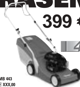
MB 443 € XXX,00

Benzinmäher MB 443. Der kleine Rasenmäher mit Fixgaseinstellung. Sehr gute Schnitt- und Fang Eigenschaften für kleine und mittlere Rasenflächen.