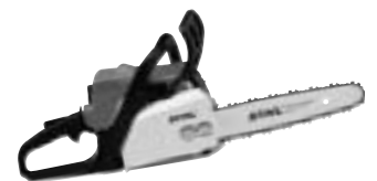
STIHL MS 170. Die handliche, leichte Motorsäge. Ideal fürs Auslichten und Brennholz schneiden.

Benzinmäher MB 443. Der kleine Rasenmäher mit Fixgaseinstellung. Sehr gute Schnitt- und Fang Eigenschaften für kleine und mittlere Rasenflächen.