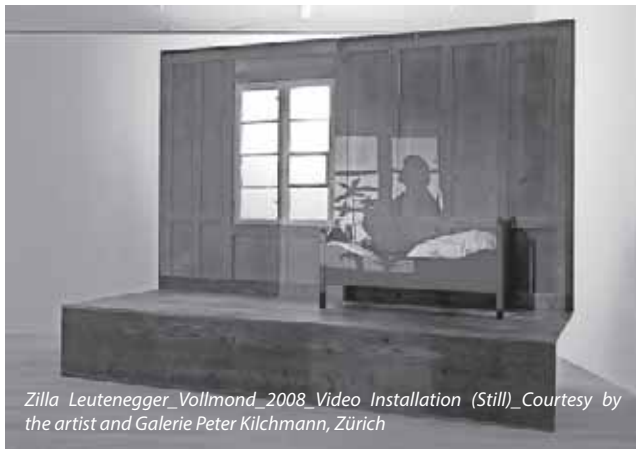
Zilla Leutenegger_Vollmond_2008_Video Installation (Still)

In Malerei, Zeichnung, Fotografie, Rauminstallation und Video reflektieren internationalen Künstlerinnen und Künstler, neben einen kunsthistorischen Exkurs in das romantische Weltverständnis des 19. Jahrhunderts, den alten Menschheits Traum vom Verstehen des Himmels. Sie zeigen Interpretationen der ersten Mondlandung und malerische Reaktionen auf das atemberaubende wissenschaftliche Bild-Repertoire des Erdtrabanten. Sie demonstrieren unser Unvermögen, die Geheimnisse des Kosmos jemals vollständig sichtbar zu machen, befassen sich mit dem Urknall, UFOs, Außerirdischen und leiten daraus ein mystisches Moment der Himmelsbeobachtung ab, das im Kontrast zu seiner naturwissenschaftlichen Erforschung steht.