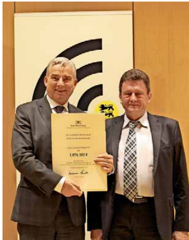
Das Bild zeigt Digitalisierungsminister Thomas Strobl gemeinsam mit Bürgermeister Josef Pfaff bei der Übergabe der Landesförderung.

MdL Thomas Dörflinger dankte in einem Gratulationsschreiben an Bürgermeister Pfaff für das Engagement der Gemeinde und ergänzte: „Ich freue mich mit den Menschen in Burgrieden, Bühl und Rot über den Erhalt von 1.076.181 Euro Landesmitteln für den Breitbandausbau. Das ist eine gewaltige Summe, mit der man bei der Versorgung mit schnellem Internet kräftig vorankommt. Wir stecken bereits mitten in der digitalen Revolution und da gehören leistungsfähige Internetverbindungen einfach zur Grundversorgung. Die damit verbundenen Chancen sind enorm, da gerade auf dem Land Standortnachteile für die Menschen und die Wirtschaft zumindest teilweise ausgeglichen werden können.“