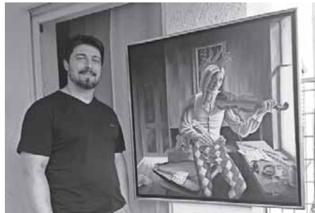
Der Künstler und eines seiner Werke.

Die Vernissage findet am 20. Oktober um 19 Uhr statt. Der Künstler lädt auf diesem Wege alle Interessenten herzlich dazu ein.