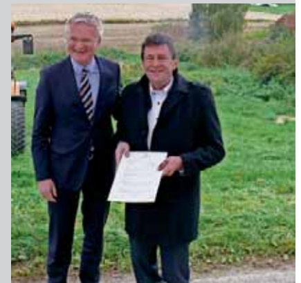
Die Landesförderung deckt einen erklecklichen Teil der Ausgaben für das Projekt. Übergabe des Förderbescheids durch Regierungsvizepräsident Dr. Remlinger.