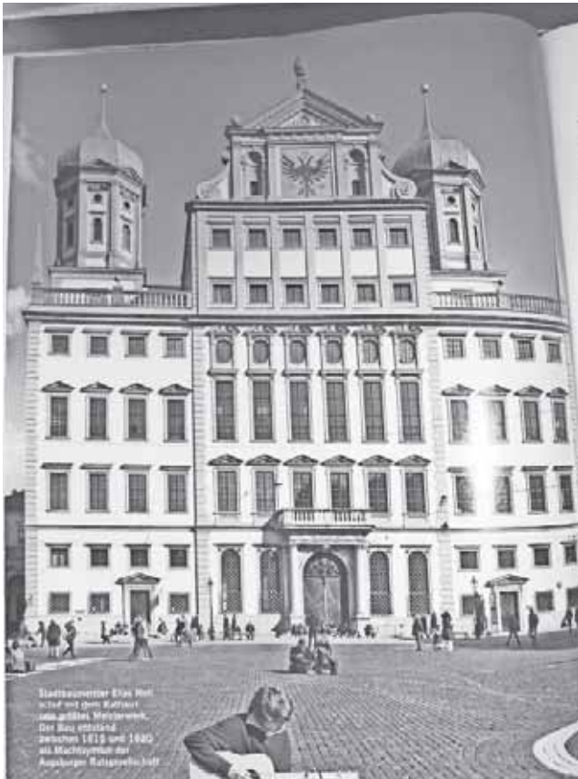
Stadtbaumeister Elias Holl schuf mit dem Rathaus in Augsburg sein größtes Bauwerk, das zwischen 1615 und 1620 entstand.