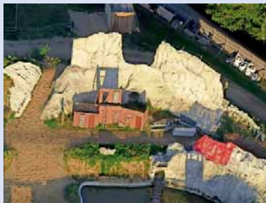
Die Kulisse steht.