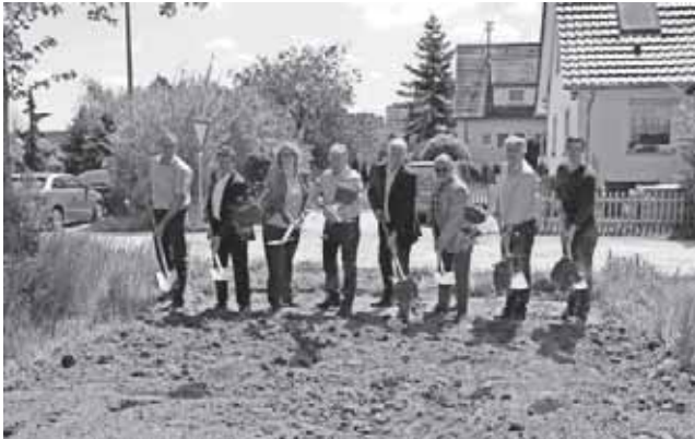
Die Baustelle des Radwegs entlang der K 7517 ist nun offiziell freigegeben.

Der Radweg kostet insgesamt rund 571.000 Euro. Rund 529.000 Euro trägt der Landkreis Biberach. Das Land Baden-Württemberg steuert einen Zuschuss in Höhe von zirka 30.000 Euro bei.