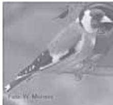
Stieglitz Vogel des Jahres 2016

Am Sonntag 21. Mai 2017 um 6 Uhr bietet der Natur- und Vogelschutzverein für alle Naturfreunde und die, die es werden wollen eine geführte Wanderung an. Zum Kennenlernen und Vertiefen der Vogelstimmen in heimischer Feld, Wald und Flur.