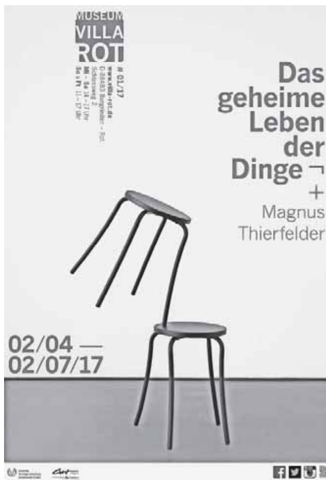
Ausstellungsplakat Das geheime Leben der Dinge + Magnus Thierfelder

So vereint die Ausstellung internationale zeitgenössische künstlerische Positionen, die den visuellen, akustischen oder taktilen Qualitäten der Alltagswelt nachspüren und die Besucherinnen und Besucher dazu motivieren, über die unmittelbare Erscheinungswelt nachzudenken.