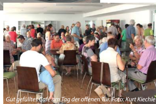
Gut gefülltes Café am Tag der offenen Tür.