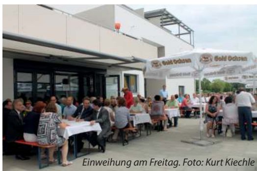
Einweihung am Freitag.