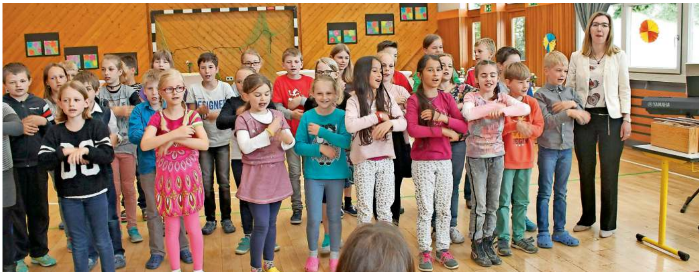
Die Kinder der Grundschule mit dem Lied „Wir sind ein tolles Team“