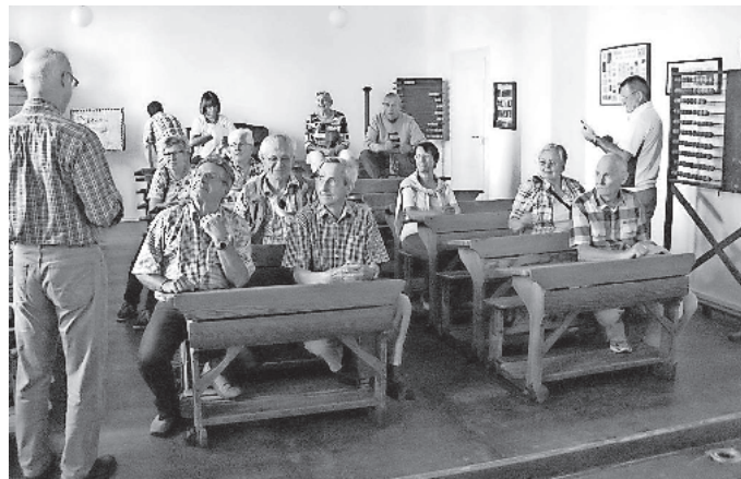
Schule, wie sie früher war. Die sehr sachkundige Führung durch das Schulmuseum in Ichenhausen war lehrreich.