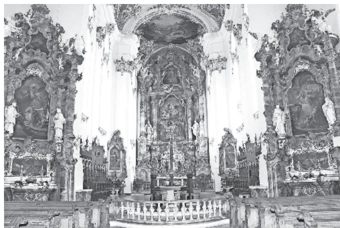
Klosterkirche Roggenburg

Eine Besichtigung mit Führung ist in der Klosterkirche Roggenburg angesagt.