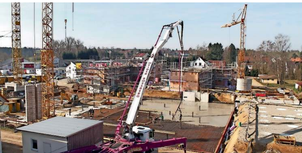
Die Betonierung der Bodenplatte für die Tiefgarage unter dem Atriumhaus sorgte vergangenen Freitag für besonders viel Betrieb auf der Baustelle des Wohnparks.