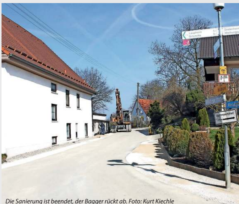
Die Sanierung ist beendet, der Bagger rückt ab.

Bei den Arbeiten wurde außer der Verfüllung des Hohlraums und einem neuen Straßen-Unterbau beispielsweise auch die Straßenentwässerung verbessert. So wurde u.a. die Wasser- rinne am Straßenrand durch eine fünfzeilige Wasserfassung ersetzt und der Einmündungsbereich in die Herdgasse wurde in die Sanierung mit einbezogen.