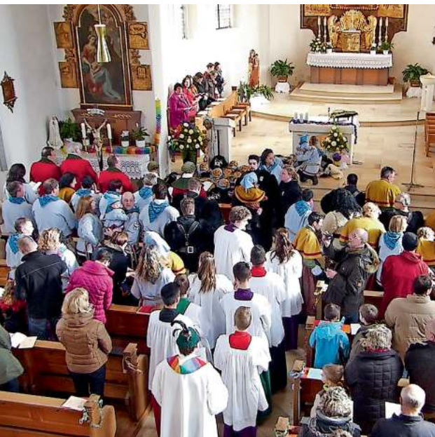
Einzug zum Fasnetsgottesdienst am 23.2.2014.