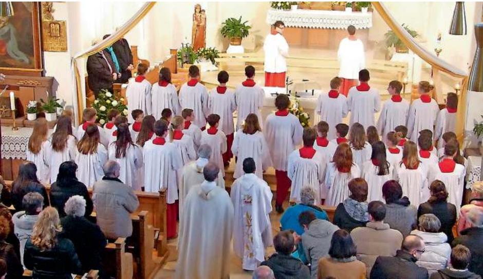
Abschiedsgottesdienst am 22.2.2014 in St.Alban. Einzug unserer drei Pfarrer mit insgesamt 46 Ministranten, darunter auch einige ehemalige Oberministranten.