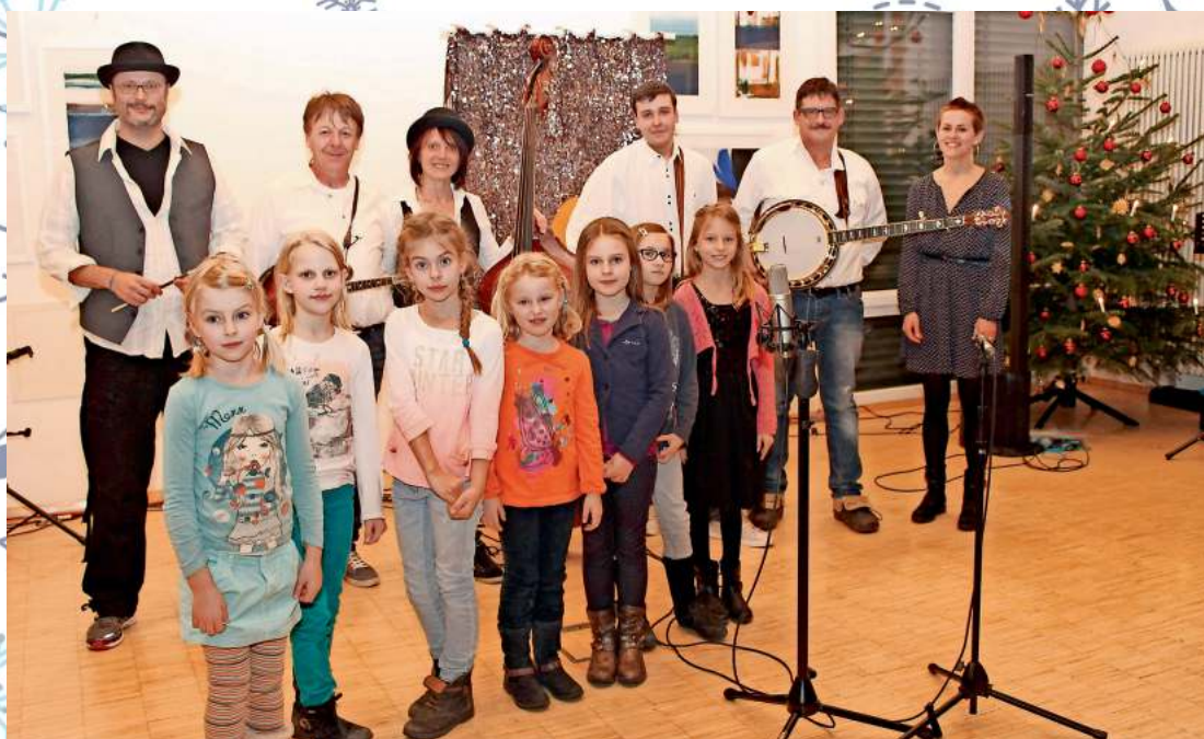
Die Teilnehmer der ersten Open-Stage-Veranstaltung des Kult.irtreffs Burgrieden.

Wen es nun juckt, selber einmal im Bürgersaal aufzutreten: nur Mut, der nächste Kult.urtreff soll im kommenden Frühjahr über die Bühne gehen. Einfach eine E-Mail schreiben an: kult.urtreff.burgrieden@gmail.com