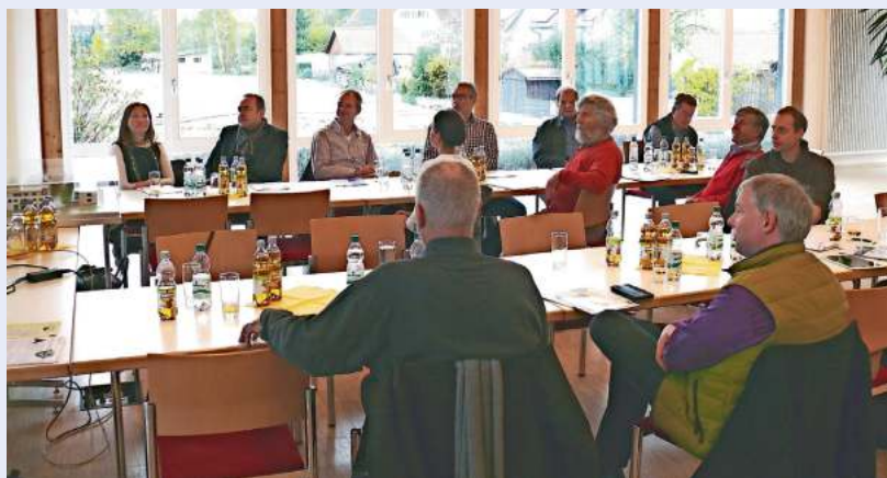
Gespannt lauschen die Teilnehmer der Wohnbustour den Ausführungen zu einem spannenden Projekt.

Die i-3-Community, hinter der die BauWohnberatung Karlsruhe steht, veranstaltet jährlich ein oder zwei sogenannte Wohnbustouren, bei denen alternative Wohnprojekte vorgestellt werden. Dieses Jahr war auch der Wohnpark „Allengerechtes Wohnen“ auf der Besuchsliste.