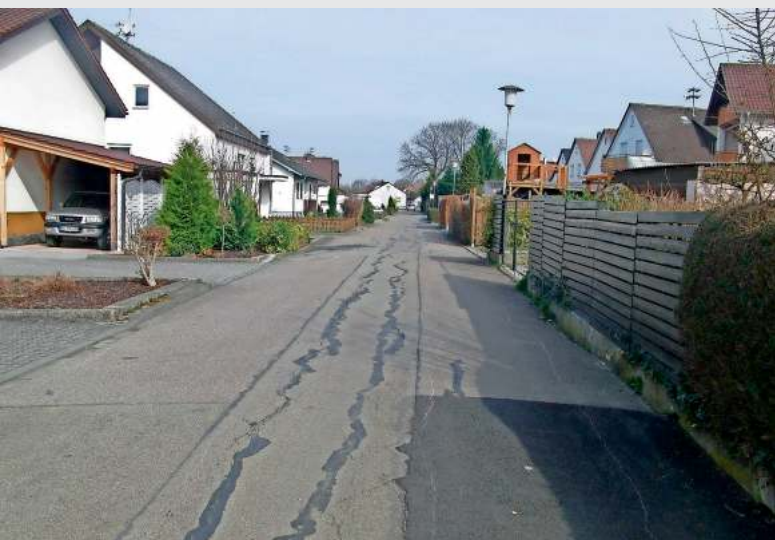
Der Lindenweg vor...

Auch den Anwohnern, welche viele Beeinträchtigungen erdulden mussten, sei an dieser Stelle gedankt.