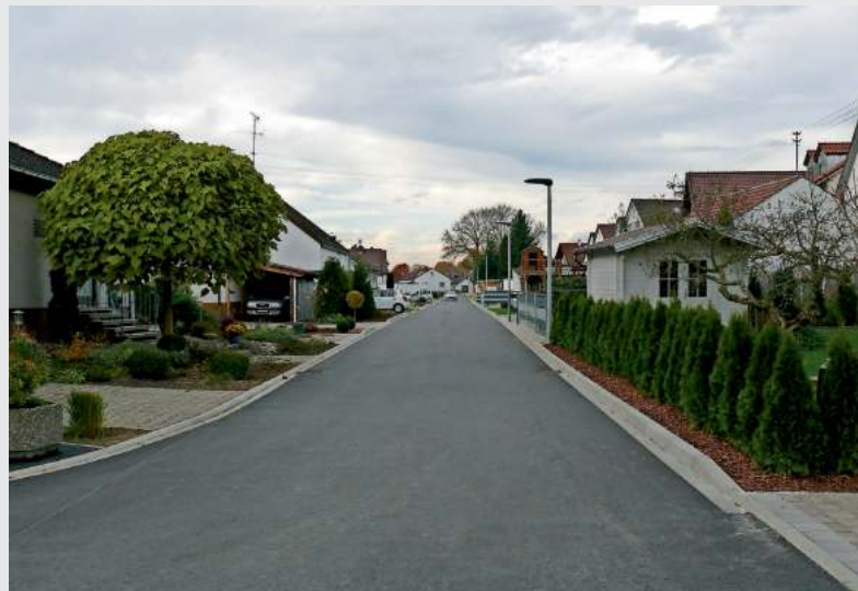
... und nach der Sanierung