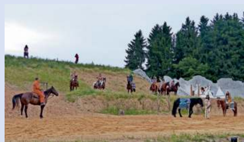
Schwierige Mission: Winnetou und Old Shatterhand bei den Utah-Indianern