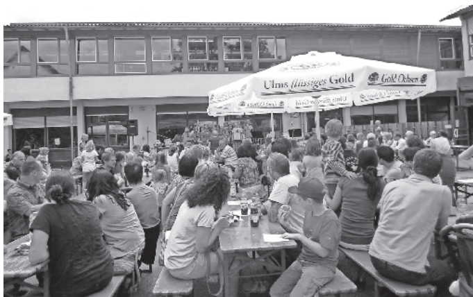
Buntes Treiben beim Schulfest 2014