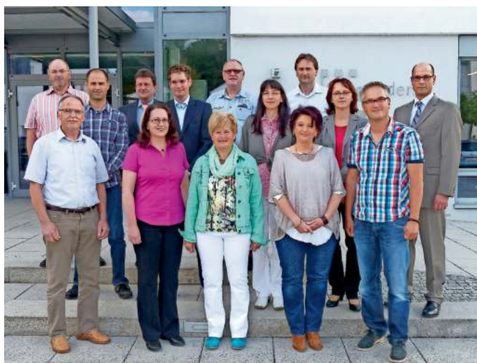
Gruppenbild mit Bürgermeister: der neue Gemeinderat ist nun offiziell im Amt