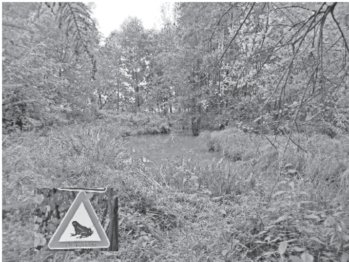
Biotop am Gattenheim

Was lebt im Bach? Becherlupe, Kescher und kleiner Eimer sind vorhanden!!!! Bitte mit entsprechender Kleidung kommen!!! wichtig Gummistiefel!!! Abholung um 18.30 Uhr. Bei schlechtem Wetter - wir hoffen es nicht - treffen wir uns am Vereinsheim "Alte Molke" Hauptstraße 32, Burgrieden