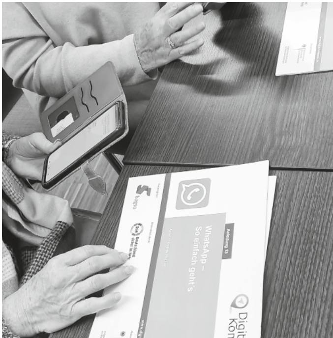
Teilnehmende beim Digitalvortrag.

lefon 07392 9288744 oder 01525 9916981. „Onliner“ können Ihre Fragen auch per E-Mail stellen. burgrieden@seniorenakademie-digital.de